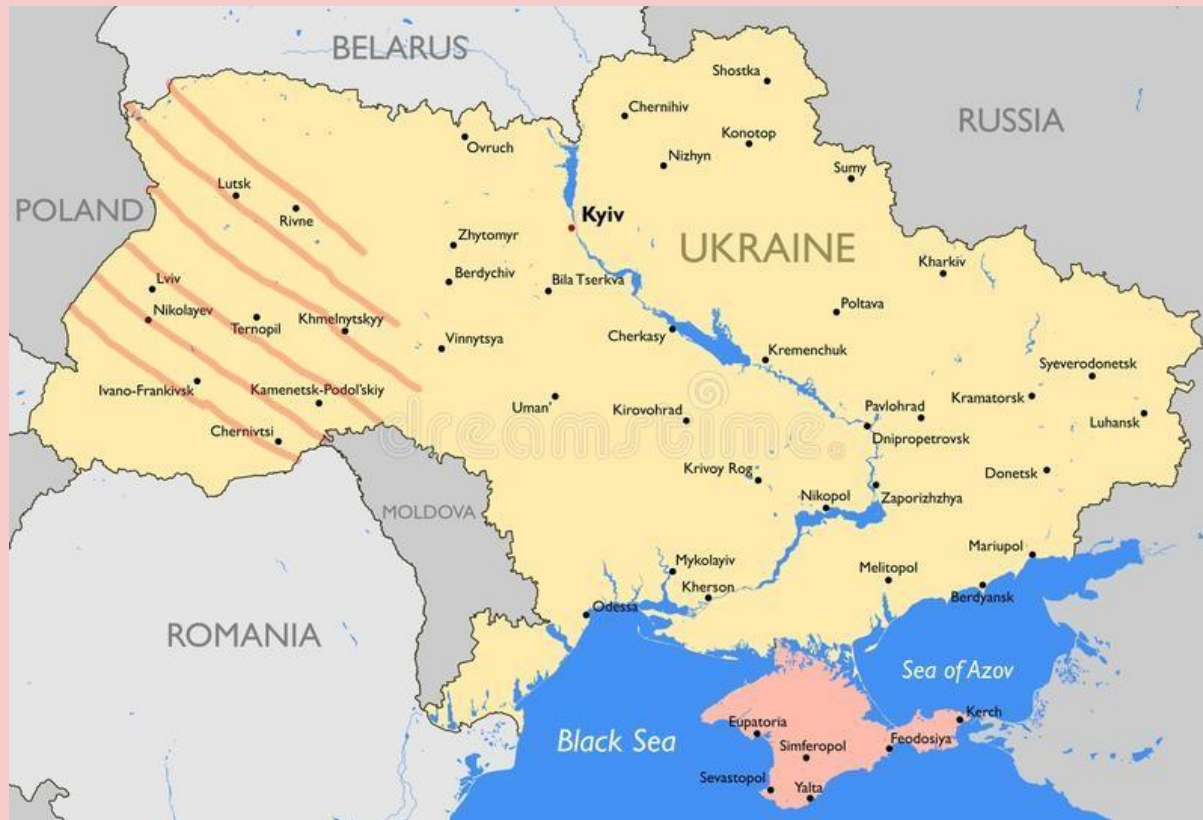
miejsca zamieszkiwane przez Polaków